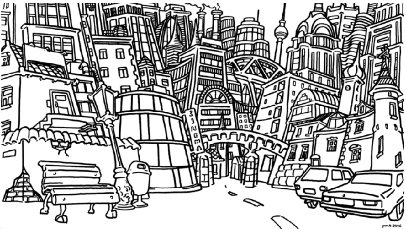
Zeichnung von Philipp Michael Börner

Schauen Sie mit den Kindern dieses Wimmelbild genauer an. Was erkennen sie darauf? Welche Gebäude haben welchen Nutzen? Was für Häuser fehlen vielleicht noch? Ähneln das Wimmelbild der Stadt, in der die Kinder wohnen?